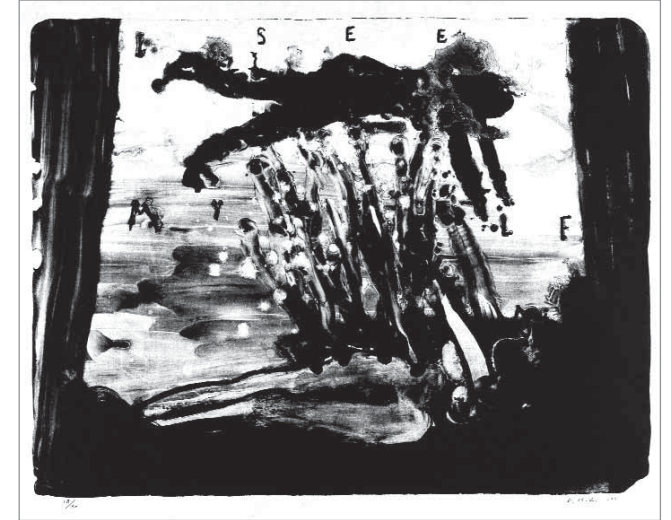
I See Myself, Lithographie auf Japanpapier, Item Editions, Paris © David Lynch

Donnerstag, 04.03.10, 18.00h Max Ernst Museum Brühl des LVR, Max-Ernst-Allee 1, 50321 Brühl Kuratorenführung, Eintritt, Führung und Umtrunk: € 8,- M / NM € 10,- zzgl. Eintritt Anmeldung erbeten bis 25.02.10 unter T 02232 45827