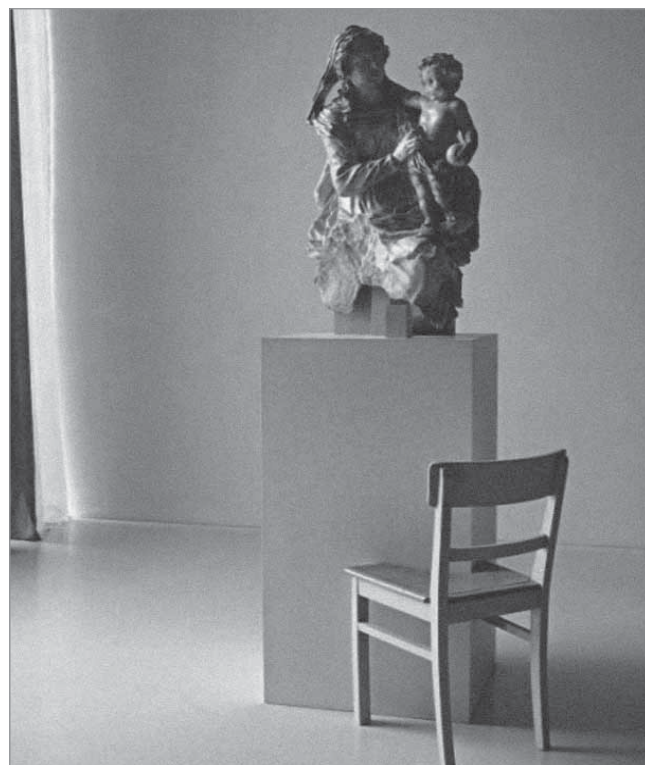
Skulptur für KOLUMBA, 2009, © 2009 Stefan Wewerka

Das neue Diözesanmuseum besticht nicht nur durch seine von Peter Zumthor so hervorragend konzipierte Verbindung alter Bausubstanz mit moderner Formgebung, sondern auch durch die spektakulären Ausstellungen, die immer wieder Überkommenes und Neues konfrontieren bzw. miteinander verbinden. So auch in der bis 30.08.2010 dauernden Ausstellung „Hinterlassenschaft“, die sich mit dem Umgang mit historischem Erbe befasst. Hier wird z.B. ein Kruzifix von 1150 einem Werk von Josef Beuys gegenüber gestellt. „Erinnerungsfähige Räume“ bilden den Brückenschlag zwischen Tradition und Moderne. Ein interessantes Terrain für Freunde der Kunst von Max Ernst!