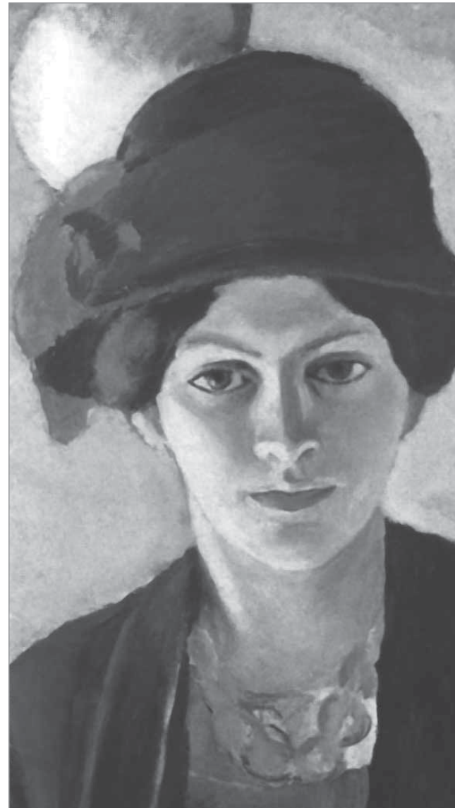
August Macke, Portrait Frau des Künstlers mit Hut, 1909. LWL - Landesmuseum für Kunst und Kulturgeschichte, Münster

Samstag, 09.01.10, 10.15h Abfahrt ab Parkplatz der Erich-Kästner-Realschule, Römerstraße 294, 50321 Brühl Fahrt, Eintritt, Führung: € 20,- M / € 23,- NM Begrenzte Teilnehmerzahl, Anmeldung erbeten bis 04.01.10 unter T 02232 45827