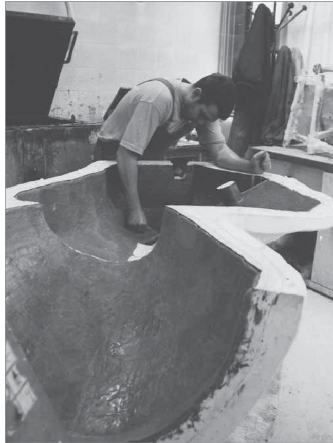
Erstellung einer Wachschiicht, die beim späteren Guss durch Bronze ersetzt wird.

Sonntag, 21.11.10, 11.30h, Max Ernst Museum Brühl des LVR, Max Ernst Allee 1, 50321 Brühl Vortrag und Umtrunk € 10,- M / € 12,- NM Anmeldung erbeten bis 09.11.10 unter T 02232 45827