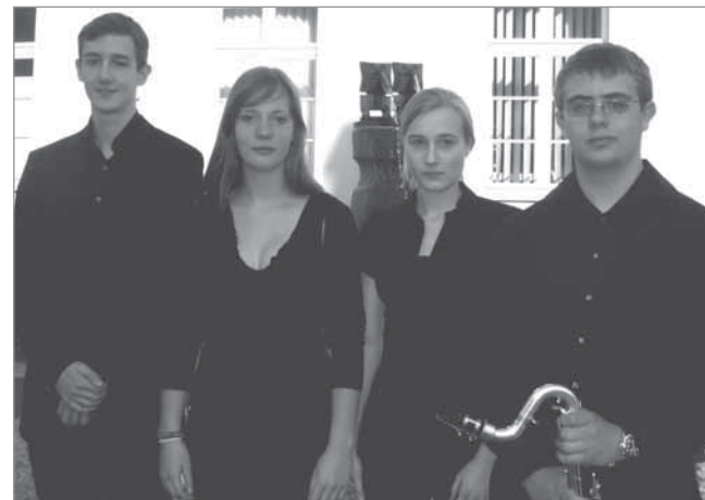
Onyx-Quartett der Kunst- und Musikschule der Stadt Brühl

Im Anschluss an das Konzert lädt die Max Ernst Gesellschaft zu einem Umtrunk und Imbiss ein.